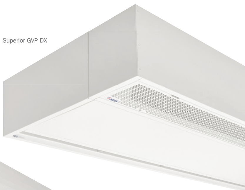
Superior GVP DX