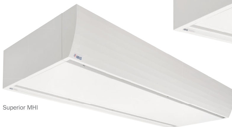
Superior GVP MHI